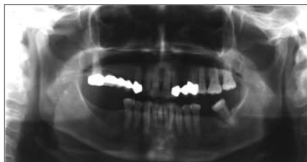
Abb. 1: Rö OPG

AK: n: LD 2 , RF 2 , Pirif 2 , Iliopsoas 2 , PMC 2 , Nackenflexoren