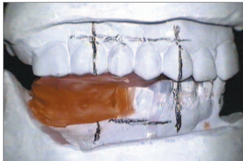
Abb. 4 Konstruktionsbiss aus Wachs (rechts) im Artikulator, ausgerichtet nach den Ebenen des Gelschen Konzeptes.