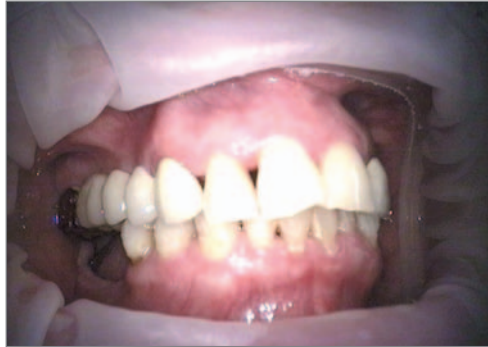
Abb. 3 Ausgangssituation im Mund mit Stützzonenverlust rechts