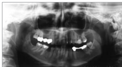
Abb. 9: Rö OPG: 22, 26 vollständige Wurzelfüllungen