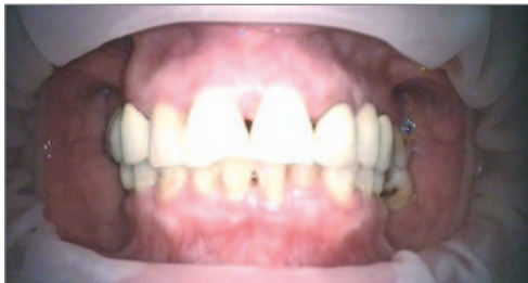
Abb. 2 Ausgangssituation im Mund (Mitte)

30.07.06 Weiter beschwerdefrei, Beratung zur prothetischen Versorgung.